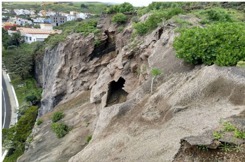
Imagen n.º 7: Oquedades y desprendimientos en zona 2

DECRETO Número: 2021-2600 Fecha: 29/09/2021