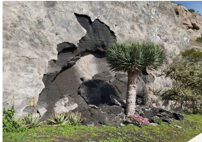
Imagen n.º 1: Rotura de la gunita proyectada y desprendimiento

“Dada cuenta del riesgo que corren, tanto los peatones como vehículos por peligro de desprendimiento al transitar por la Calle La Constitución en Valverde,-HI2-, titularidad de ese Cabildo Insular, ( Frente al Helipuerto, cerca de curva para Echedo), debido a que se está desprendiendo el mortero proyectado en la montaña para la sujeción de la misma, de lo cual se adjuntan fotos, por medio del presente se solicita de ese Cabildo Insular, Área de Infraestructuras, se proceda a señalar la zona por peligro de desprendimiento y a su vez, proceda al arreglo de lo mencionado dada la afluencia de vehículos y peatones por la zona.”