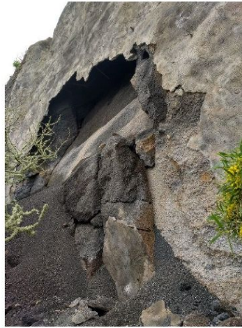
Imagen n.º 6: Rotura del gunita y desprendimiento en zona 1