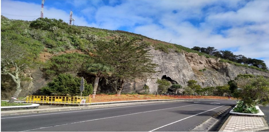
Imagen n.º 4: Balizamiento del jardín a pie de talud