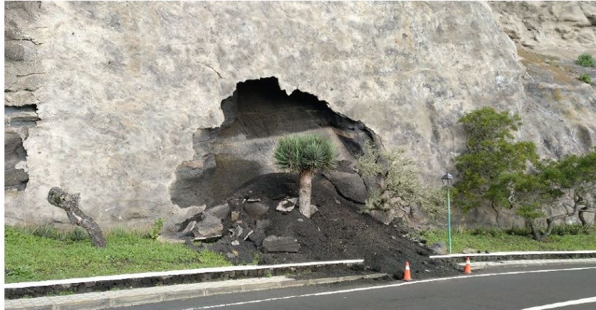
Imagen n.º 2: Segunda rotura de la gunita proyectada y desprendimiento del material, 3 de febrero de 2021

Posteriormente, el día 9 de enero de produce un nuevo desprendimiento, esta vez coincidente con la cabecera del talud, P.K. 8+300 de la carretera HI-2.